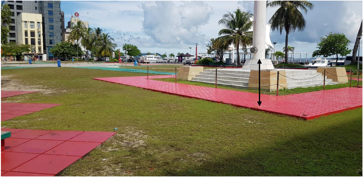
ارتفاع ستون 1400 دد